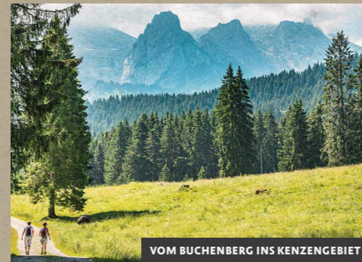
VOM BUCHENBERG INS KENZENGEBIET